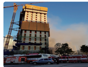
광교○○ 신축공사 중 화재 ('17. 12. 25 사망1, 부상 13)