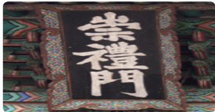
송례문 현판 - 송례란 불불 활활 타오르는 모습, 불의 기운이 많은 관악산 불에 대해 맞불을 놓는다는 속설