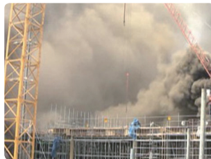
서울 종로 미술관 신축공사 화재 ('12. 8. 13 사망4, 부상9)