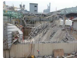
폐수 환경설비 구축공사 중 폭발 ('15. 7. 3 사망6, 부상1)