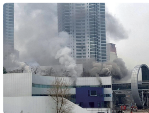
상가매장 복구공사 중 화재 ('17. 2. 4 사망4, 부상 47)