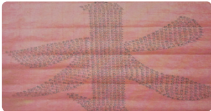
근정전 부적 - 비를 내린다는 용(龍)자를 1,000여개 수를 놓아 만든 부적