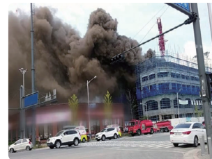
근린생활시설 신축공사 화재 ('16. 9. 10 사망4, 부상2)