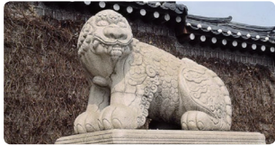
광화문 해태상 - 불을 보면 물을 뿜어 불을 막는다는 속설