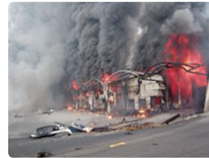
이천 물류 냉동창고 신축공사 화재 ('08. 1. 7 사망40, 부상10)