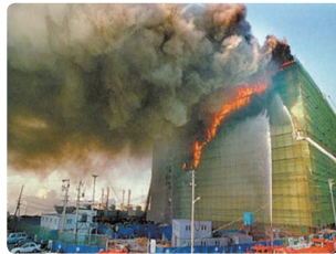
부산 냉동창고 신축공사 화재 ('98. 10. 29 사망27, 부상16)