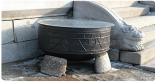
근정전 드므 - 드므에 물을 가득채워 두면 침입해 오던 화마가 물에 비친 자신의 모습을 보고 놀라 달아난다는 속설