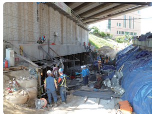
북선철철 교량 하부보강 중 LPG폭발 ('16. 6. 1 사망4, 부상10)